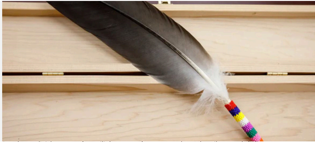
Les plumes d'aigle peuvent être utilisées pour prêter serment devant les tribunaux de l'Alberta.

S'était 1991 lorsque le rapport révolutionnaire de l'enquête sur la justice autochtone (AJI) a été publié au Manitoba. Après deux années d'entrevues auprès d'une gamme de personnes - des communautés éloignées du Nord, des représentants juridiques des salles à Winnipeg, des membres de la famille de personnes décédées en raison de la violence, des personnes incarcérées - les Juristes Murray Sinclair et Alvin Hamilton ont produit un rapport approfondi sur les façons dont le système juridique est un échec pour les peuples indigènes qui combinés avec le racisme et la discrimination structurelle et son colonialisme. Parmi les recommandations de l'Aji, il y avait un appel à la création d'un «système de justice autochtone» qui répondrait aux dommages et aux actes répréhensibles par des méthodes transformatrices culturellement appropriées.